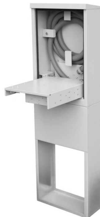
RSZ-140/44/20 - 72J