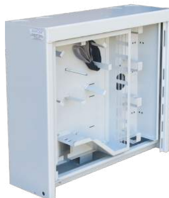
M 42/48/16 ST - DX 72J