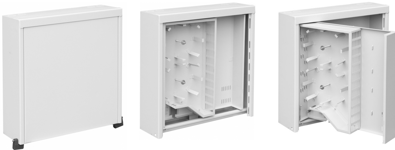
M 52/52/16 ST 144J