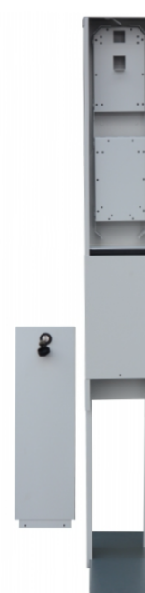
RSZ-146/18/10 - 16J