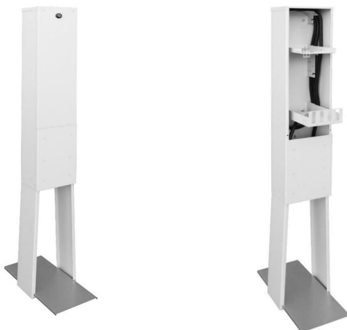
RSZ-160/18/14 - 24J