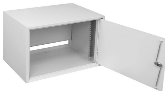
TPR-35/55/40 19" 6U