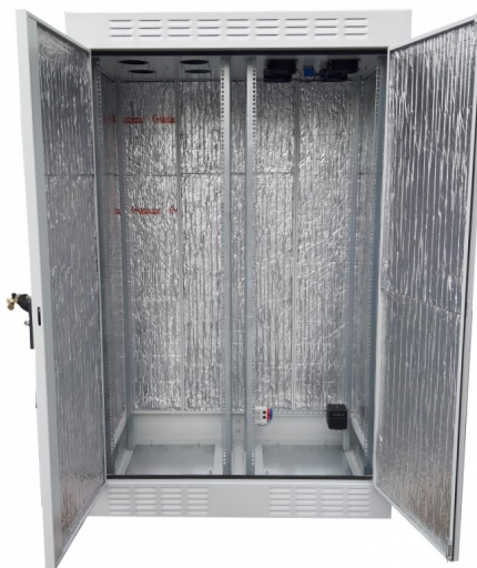
SZK 36U 192/120/80