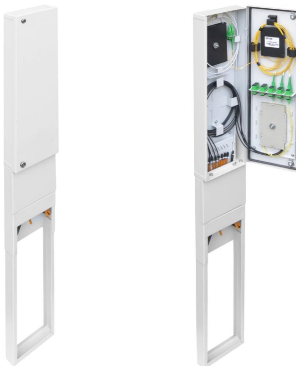
RSZ-125/18/6 - 15J