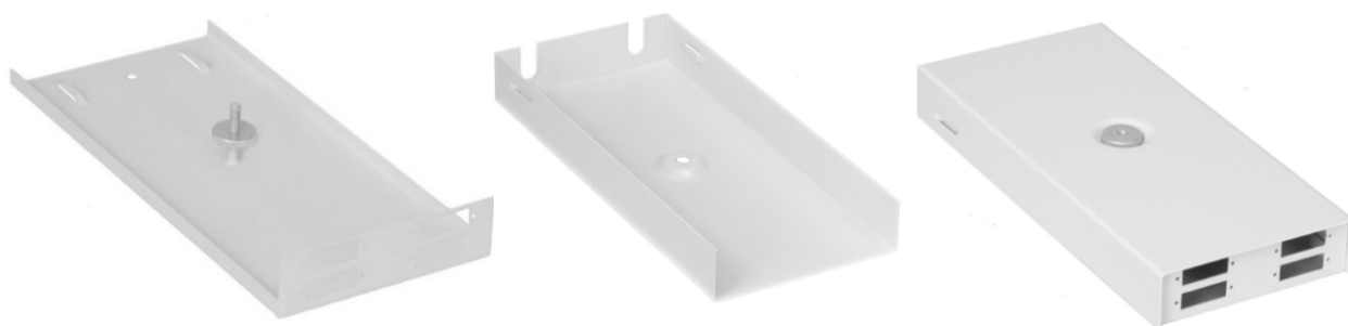
PSN 1 4xDX