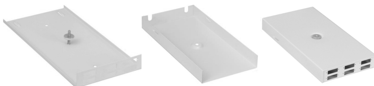
PSN 2 6xDX