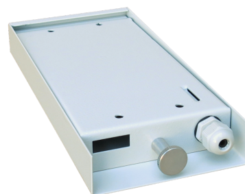
PSN - A