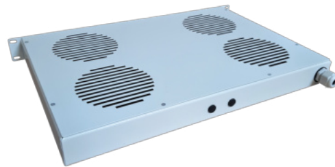
PW 1U 19" 4 wentylatory