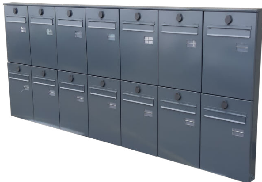
Blok skrzynek na listy