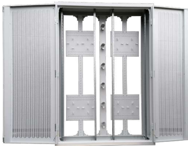
SWS 42U 19" 140x35