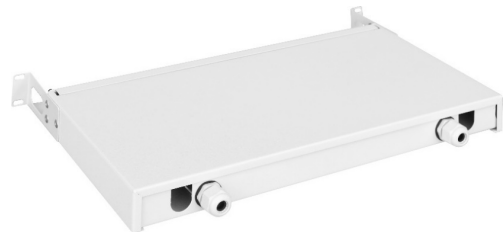
PS 19" 1U 24xDX W bp