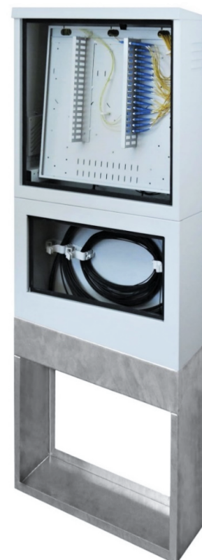
RSZ-170/60/20 - 144J