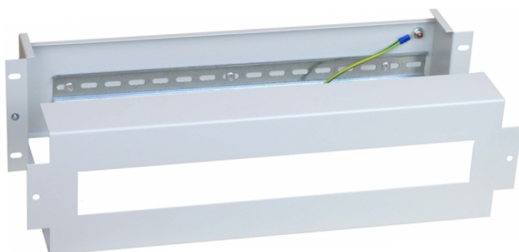
Panel dystrybucji napięć 19"