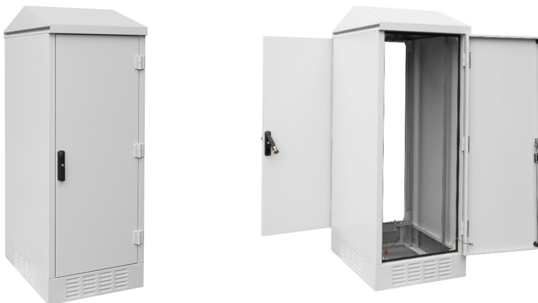
SZK-30U 19" dual