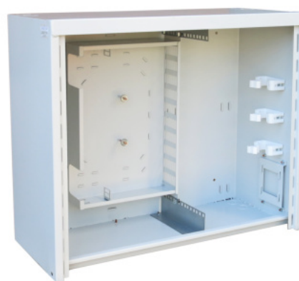
M 58/70/30 ST